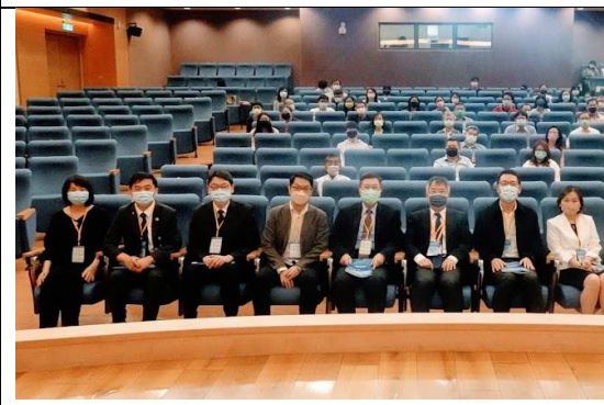
講者與來賓大合照