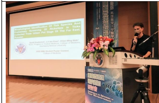
碩士組第一名壁報論文報告