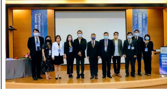
講者與來賓大合照