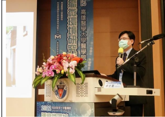
卓士峯助理教授演講