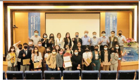
得獎者與師長合照