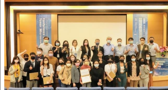
壁報得獎來賓大合照