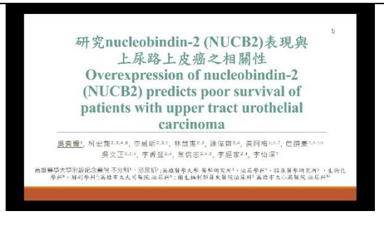
大學組第一名壁報論文報告(線上)