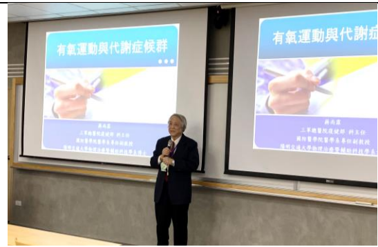
開場 (內分泌及新陳代謝學會創會理事長—王錫崗教授)